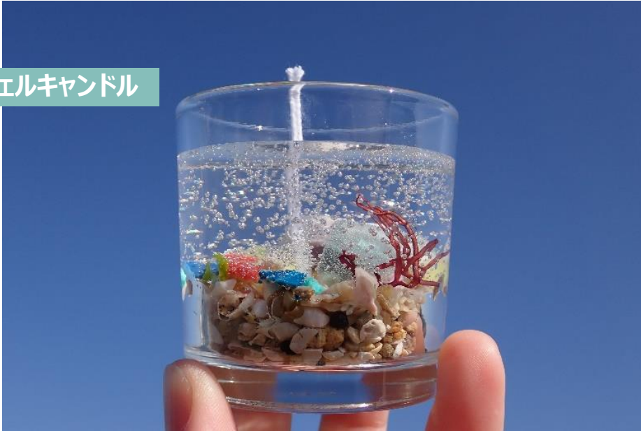
ジェルキャンドル