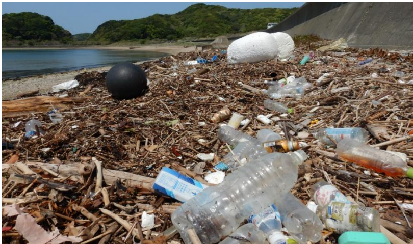
答志島（奈佐の浜）の海岸の様子