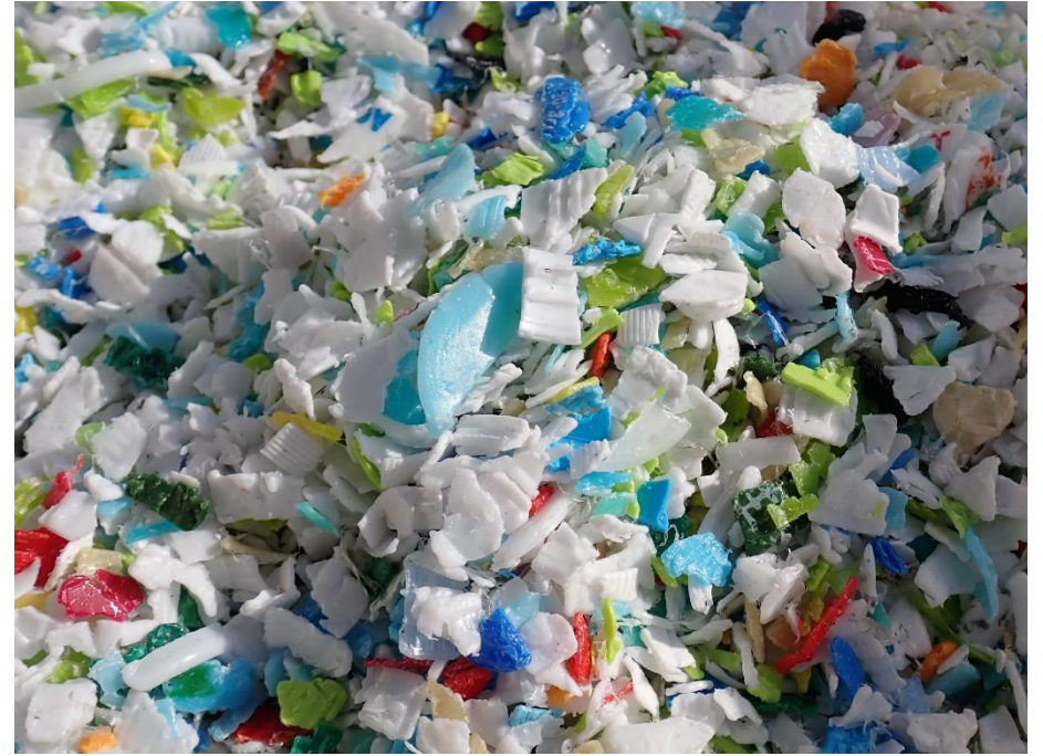
海洋プラスチック