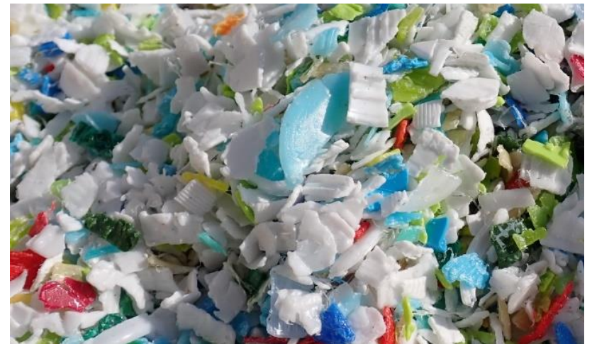
海洋プラスチックごみを小さなクラフト用パーツに！