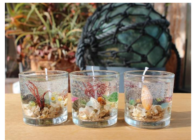
ジェルキャンドル作り